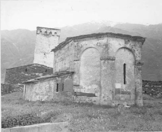
8. ზაფხიანი მასალა